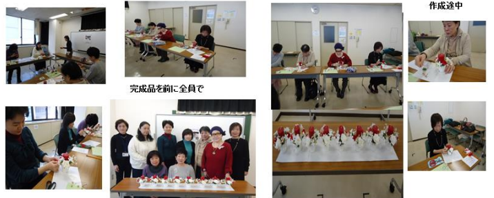
完成品を前に全員で