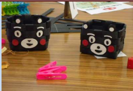
くまもん小物入れ —京橋区民館—