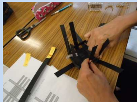
さき織りぞうり講習会 —京橋プラザ区民館—